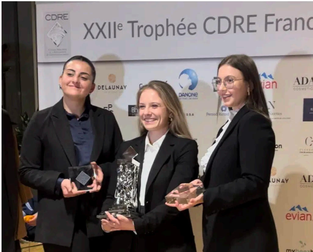
CDRE FRANCE 2024 – finale archives

Pour ce concours, Il est attendu des candidats, de revêtir la casquette du Directeur d'Exploitation d'un hôtel**** de 40 chambres ouvert toute l'année.